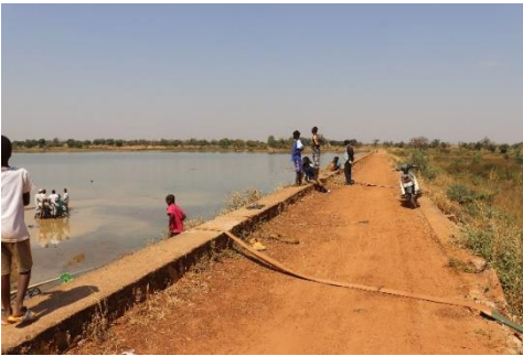
Waterpomp en dijk

Er wordt een stuk land gehuurd aan de rand van de stad. De velden moeten bewerkt worden, de pomp moet voor water zorgen en er moeten dan verschillende plantjes gekocht worden.