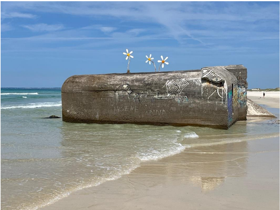
Plage de Tronoën, Bretagne (Fr.)